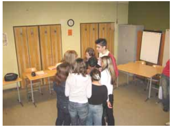
Szenen aus der Übung "Der Bannkreis"