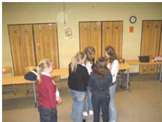
Szene aus der Übung "Kontaktaufnahme"