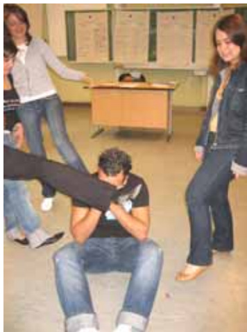
Statuentheater zu eigenen Gewalterfahrungen